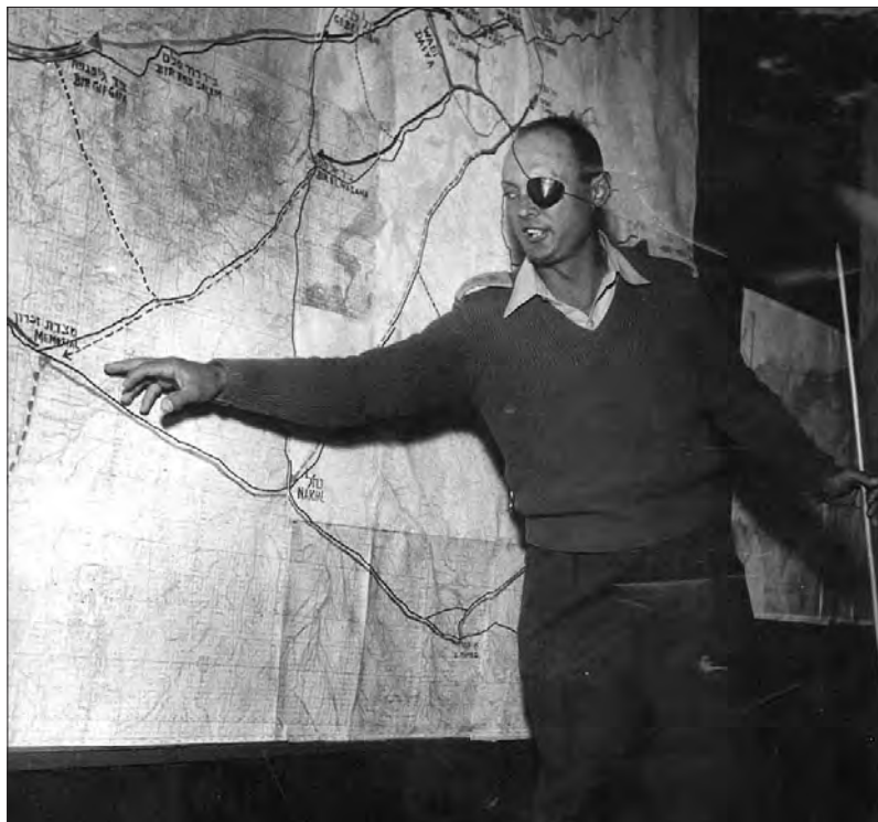
Моше Даян, ноябрь 1956 г.

И тогда победила точка зрения министерства обороны Франции, которое предлагало создать Насеру проблемы на его восточном фланге.